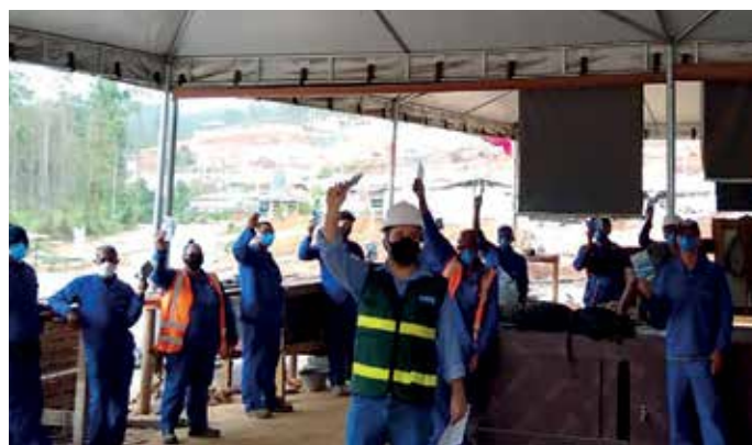
Após DDS (Diálogo Diário do Sistema) da campanha de combate a COVID-19, os colaboradores da unidade ergueram suas máscaras como um ato de comprometimento com o uso do EPI (Equipamento de Proteção Individual).