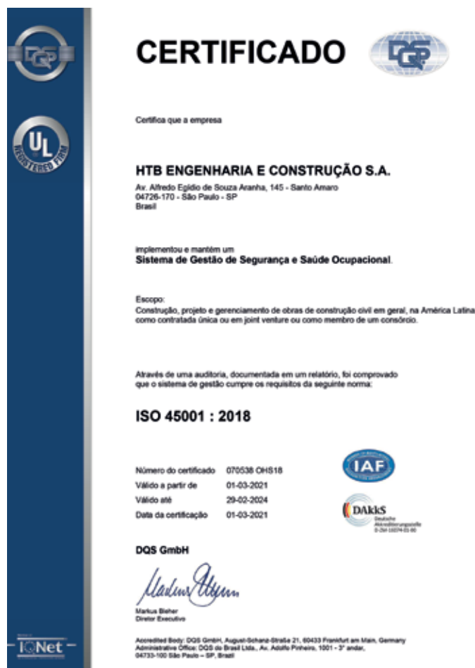
Certificação ISO 45001 do Grupo HTB.