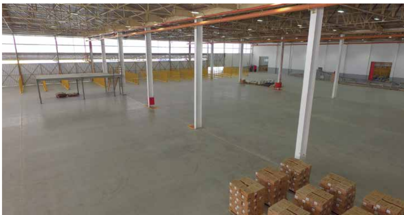
Vista interna do empreendimento.