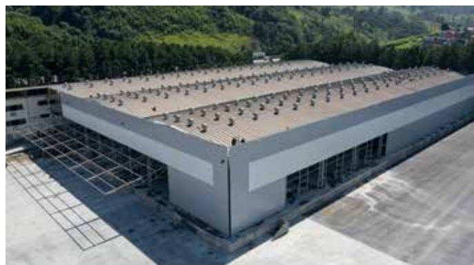
Detalhe do serviço de retrofit do empreendimento.

Dos serviços já executados, destaca-se o redimensionamento de toda a drenagem: que foi reparada, passou a ser enterrada e ainda: