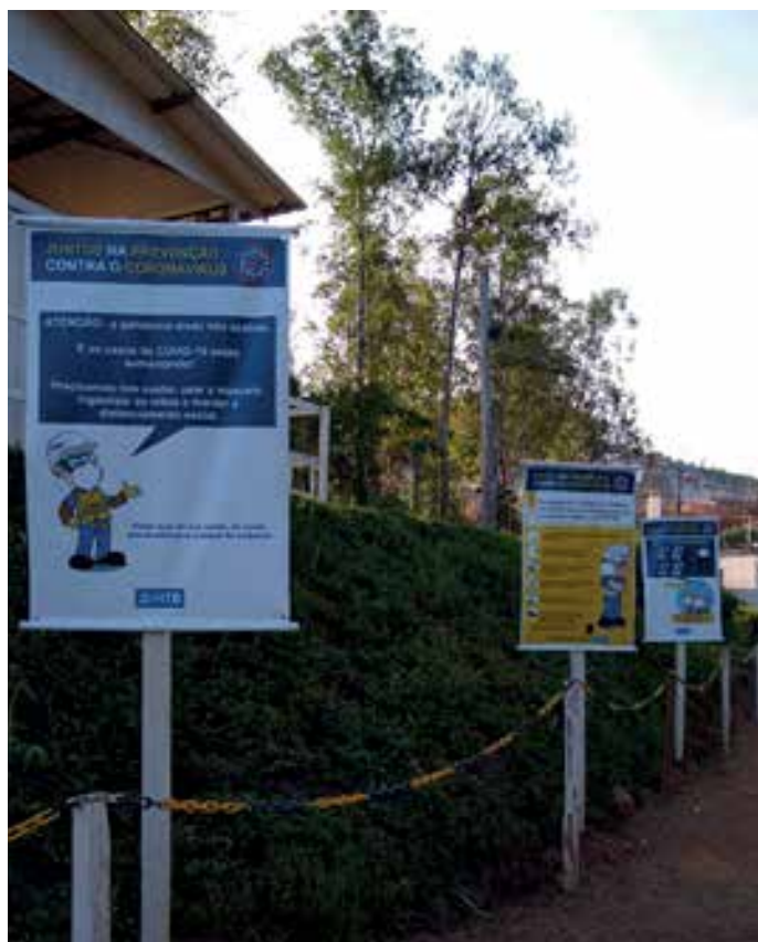
Comunicação visual ao longo de todo o canteiro de obra.