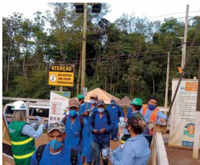
Distribuição de máscaras.