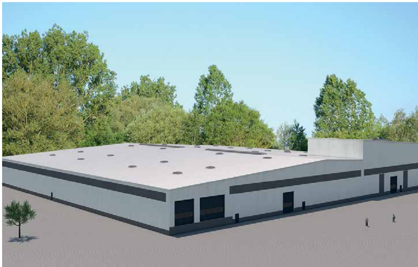
Perspectiva do projeto.

A mudança para o novo centro de remediação de solo em Niederlehme está programada para ser concluída até o final desse ano.