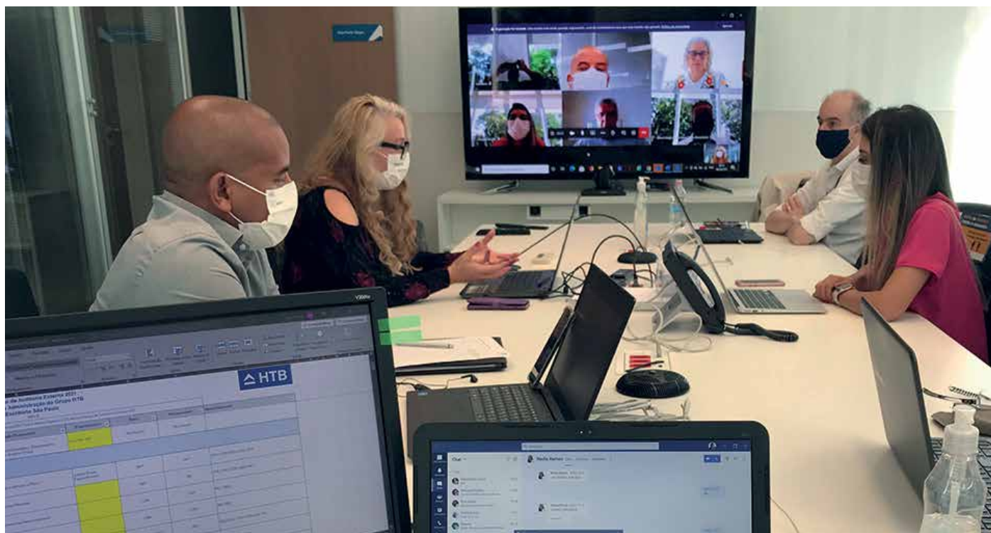
Auditoria realizada com a empresa DQS Brasil.