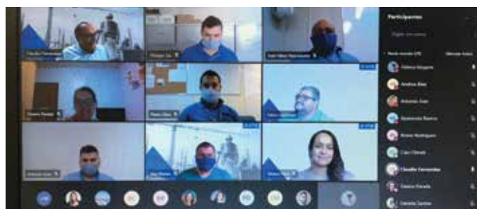
Treinamentos realizados on-line para obras e colaboradores em regime home office.

O Grupo HTB tem a certeza de que a manutenção de processos e negócios fundamentados na ética, transparência e integridade constrói relações fortes e duradouras com seus colaboradores, clientes e demais stakeholders (públicos de interesse), gerando valor, reforçando a credibilidade já conquistada por sua marca e garantindo sua sustentabilidade.