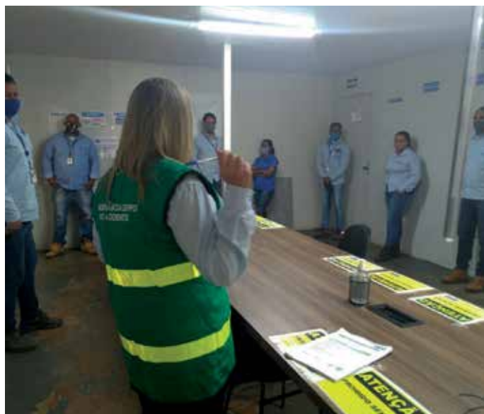
Conscientização para colaboradores da área administrativa da UN.