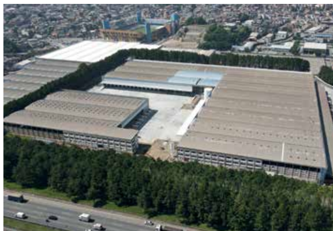
Comparativo: à esquerda, centros de distribuição antes. À direita, com os serviços de retrofit em andamento.

A HTB está executando o retrofit de dois centros de distribuição, localizados em Barueri - SP, para o cliente Grupo Moriano, proprietário de galpões logísticos para locação.